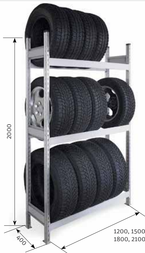
Стеллаж СТ-023 для автомобильных шин