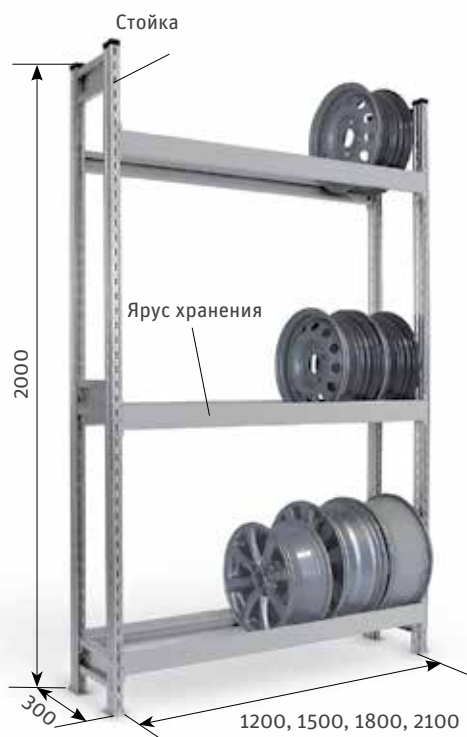
Стеллаж СТ-023 для автомобильных дисков